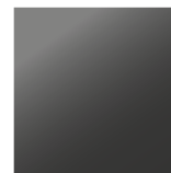
schwarz matt 3954 RAL 9005