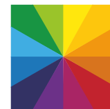
farbig nach RAL seidenglanz